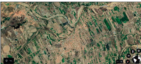
Figura 2 – Vista aérea do município de Limoeiro do Norte através do programa Google Earth

Situado no setor leste do Estado do Ceará, o baixo vale do Jaguaribe compreende a sub-bacia hidrográfica do rio de denominação homônima, sendo também o mais importante recurso hídrico do Estado. Drenando uma área equivalente à metade do espaço cearense, o rio Jaguaribe, em seus 610 km de curso, faz-se presente nas mais diversificadas áreas até atingir seu baixo curso onde desenvolve uma planície situada em um grande vale que se alarga para jusante.