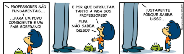
Figura 2 – Tirinha Armandinho – 15 de outubro de 2021