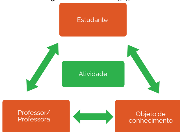
Figura 1 – Núcleo Pedagógico.

A atuação do(a) professor(a) não se dá de forma isolada, mas em constante diálogo com as particularidades dos(as) estudantes e com as características específicas do conhecimento a ser ensinado. É na dinâmica dessa interconexão que se moldam as estratégias e as rotinas que definem a prática, tornando-a contextualizada e eficaz, conforme Figura 1.