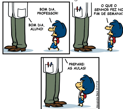
Figura 4 – Tirinha Armandinho – 15 de outubro de 2022 - carrossel - segunda