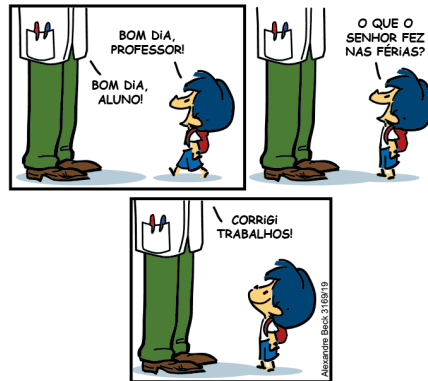
Figura 3 – Tirinha Armandinho – 15 de outubro de 2022 - carrossel - primeira