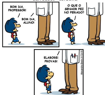
Figura 5 – Tirinha Armandinho – 15 de outubro de 2022 - carrossel - terceira