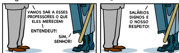
Figura 1 - Tirinha Armandinho - 15 de outubro de 2020