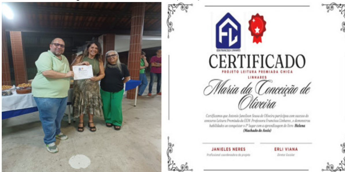
Figura 1 – (A) Alunos da EJA durante premiação; (B) Modelo de certificado.